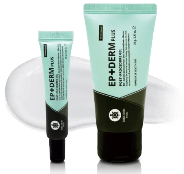
POST PROCEDURE GEL EP+DERM PLUS