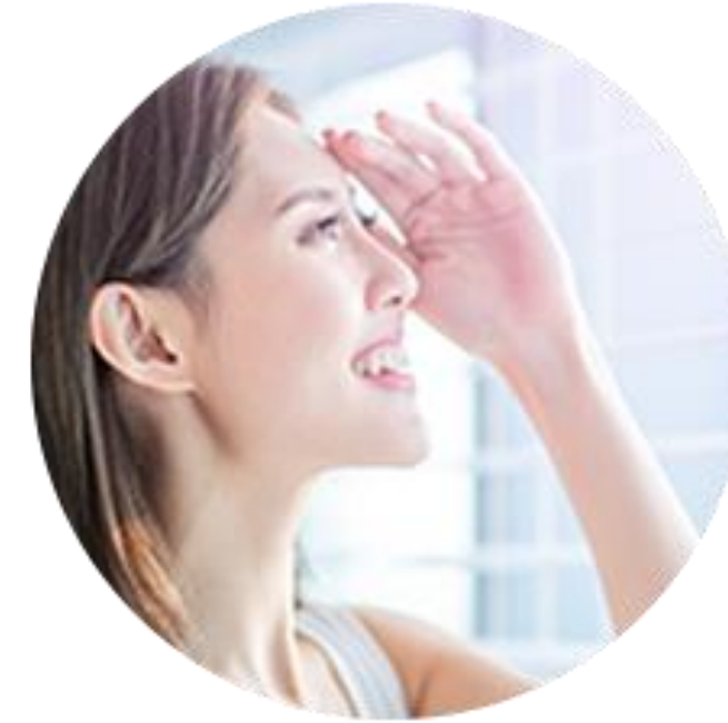
Po ekspozycji na promieniowanie UV