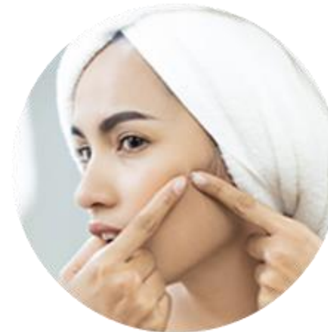
Po ekstrakcji trądziku