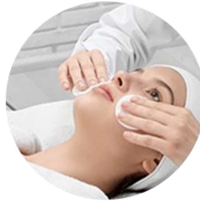
Po zabiegach dermatologicznych