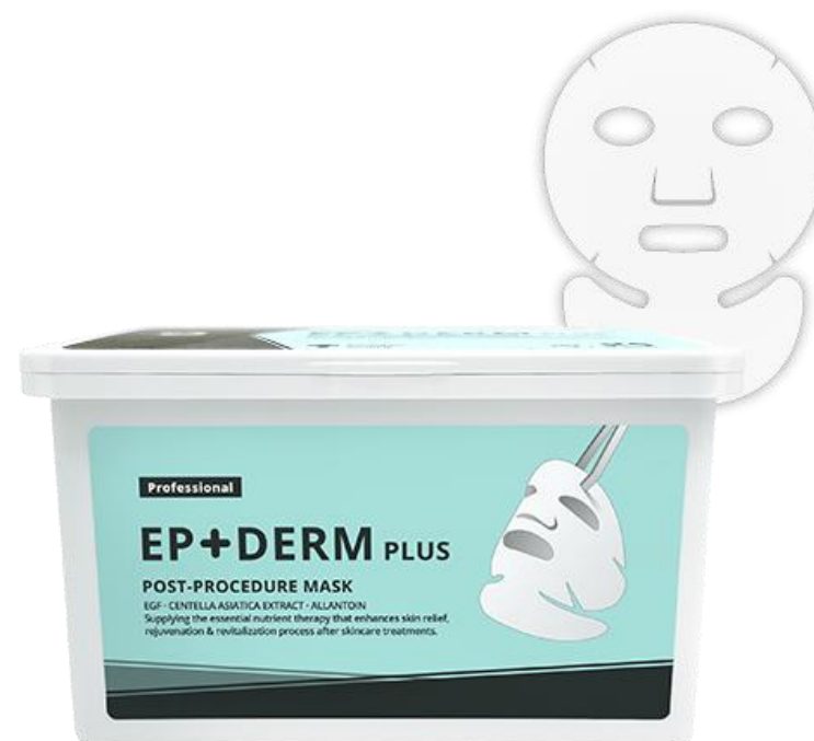
POST PROCEDURE MASK EP+DERM PLUS

EP+DERM Plus Post-Procedure Gel to krem po zabiegach, który szybko regeneruje uszkodzoną skórę po zabiegach dermatologicznych dając uczucie ukojenia.